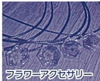
フラワーアクセサリー